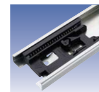
Mechanizm zwalniania dotykowego