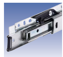
Szyna szybkiego montażu