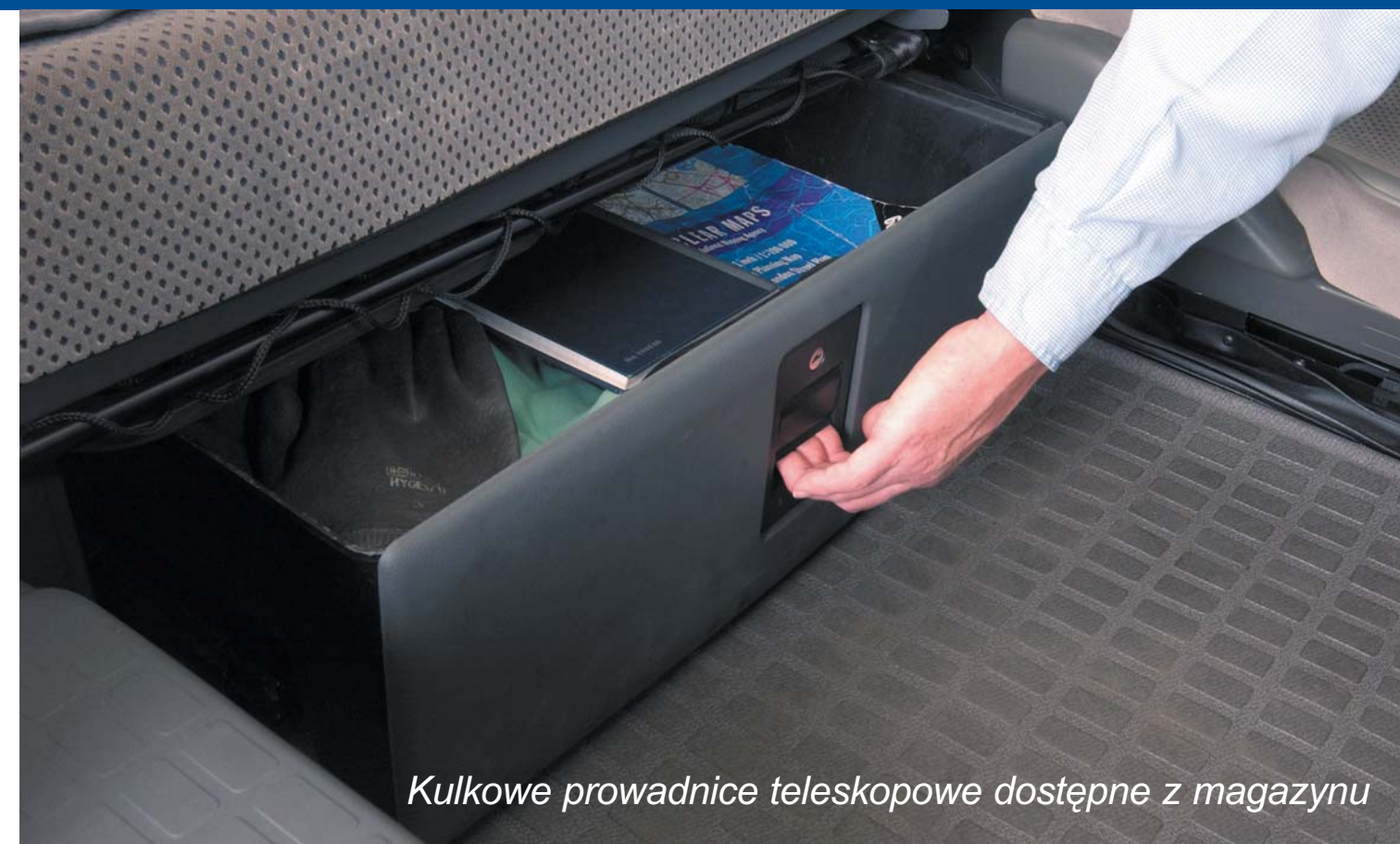
Kulkowe prowadnice teleskopowe dostępne z magazynu

Tel: +49 (0) 6432 608-0 Fax: +49 (0) 6432 608-320